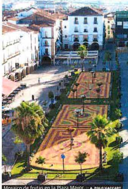
Mosaico de frutas en la Plaza Mayor. ... A. POLO HACCART

Entre en la iglesia de San Francisco Javier después de subir las escaleras protegidas por la estana en bronce de San