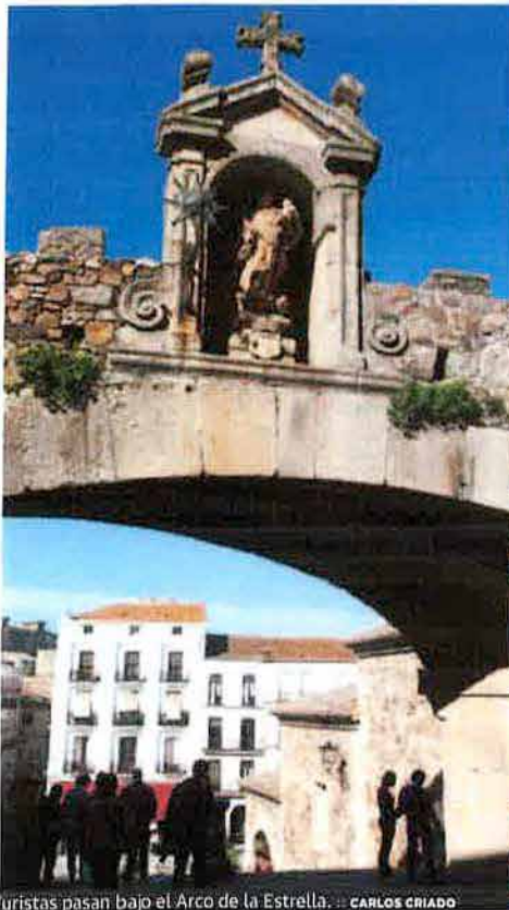
Turistas pasan bajo el Arco de la Estrella. ... CARLOS CRIADO