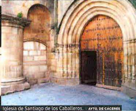
Iglesia de Santiago de los Caballeros. ... AYTO. DE CÁCERES