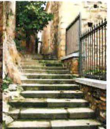
Callejón de Don Alvaro. ... AYTO. DE CÁCERES